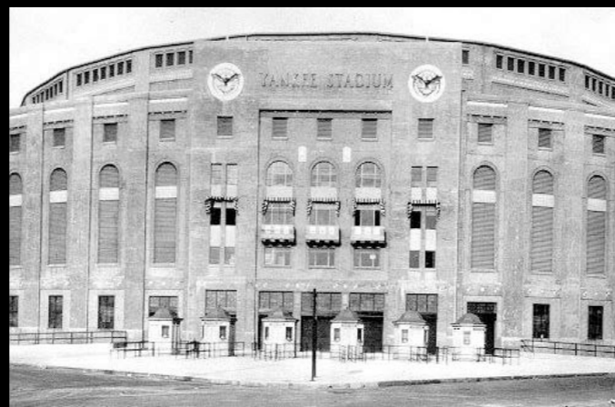
Ärevördiga Yankee Stadium rivs för en ny anläggning.

Ett förbud mot att riva den gamla läktaren för att sedan återskapa dess fasad mot Kungsbäcksvägen skulle stoppa hela Strömvasallen-Konserthusprojektet. I London och New York insåg och inser man att förändring ibland är nödvändig, att allt inte alltid kan förbli vid det gamla. Så revs till exempel klassiska Wembley och en ny funktionell arena byggdes istället på samma plats. Samma sak med ärevördiga Yankee Stadium som nu rivs för att ge plats åt en anläggning med moderna kvaliteter. Inga jämförelser med Gävle i övrigt. Men allt har sin tid.