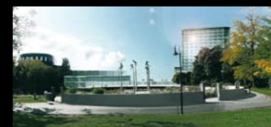
Från Millesstatyerna i Stadsträdgården