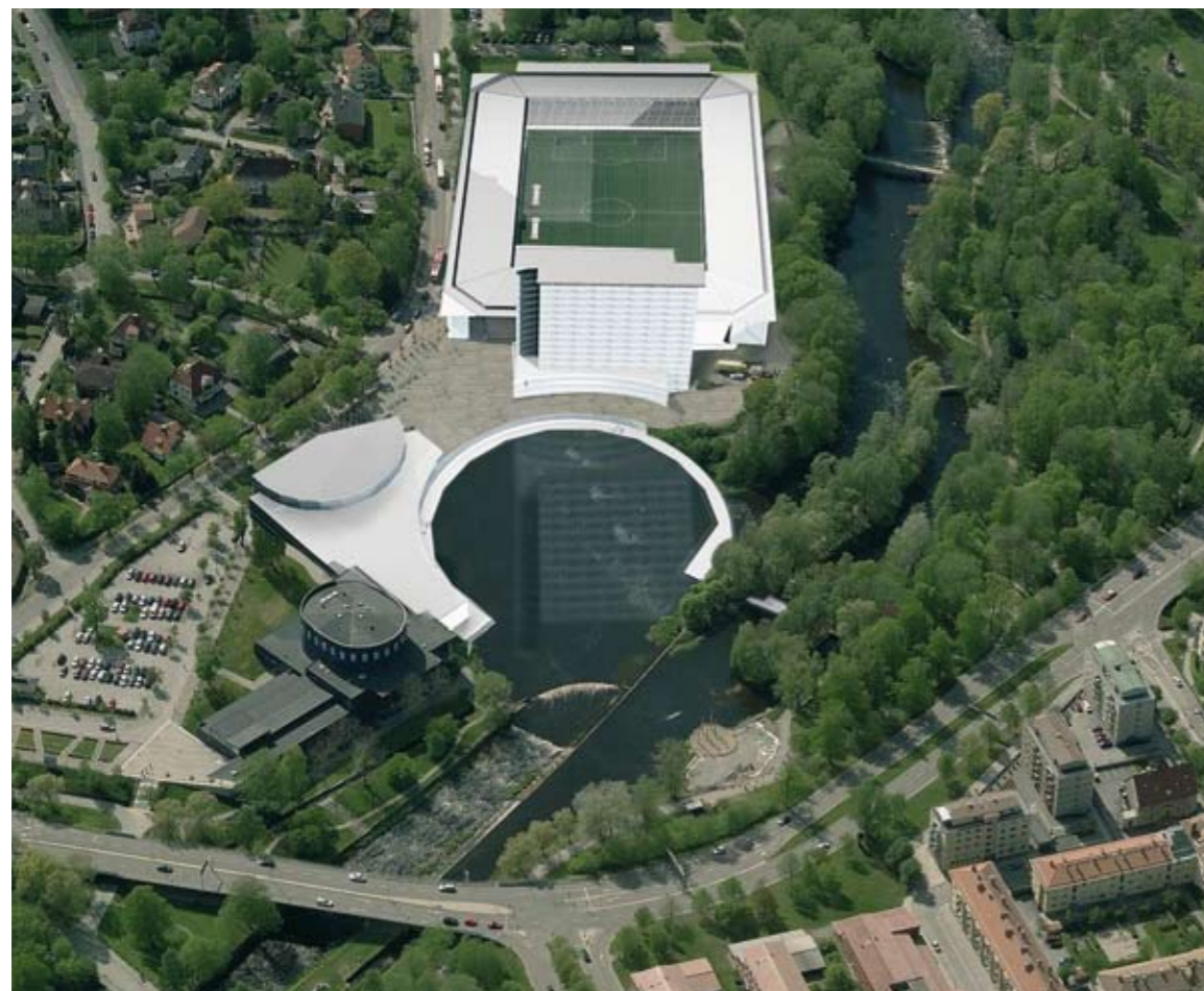
Mellan hotellet och evenemangshallen öppnas vägen till å-promenaden. Här anläggs också ett torg.

Var för sig skulle alla delar i projektet kunna diskuteras. Men exempelvis konserthuset, som är en för projektet avgörande ingrediens, låter sig knappast flyttas. Konserthusverksamhetens utveckling, i samverkan med kongress- och evenemangsverksamheten och hotellet är ju kärnan i hela den delen av konceptet. Utan det sammanhanget faller konceptet och därmed projektet, som alltså ur idésynpunkt är djupt förknippat med platsen.